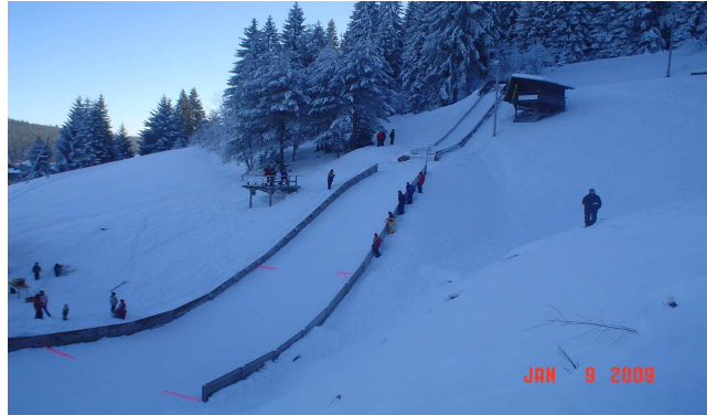
SC Blasiwald 06.02.2011 K 10 K 28